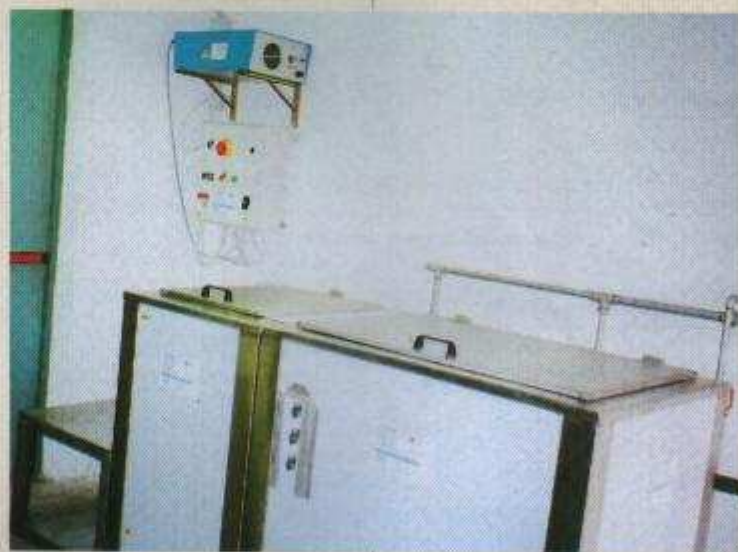
Impianto di lavaggio e manutenzione di stampi modello 3 VS 300 I speciale.

Ultrasuoni I.E. è in grado di risolvere, con le proprie macchine e impianti, una vasta gamma di esigenze nel lavaggio industriale: da particolari di pochi millimetri a stampi di grosse dimensioni. L'utilizzo di queste macchine ha sempre elevato il livello qualitativo della produzione degli utilizzatori, eliminando costi, tempi morti, manodopera inutile e lavori pesanti di aggiustaggio. In particolare, presso numerosi utilizzatori di prodotti Ultrasuoni I.E. si sono riscontrati numerosi vantaggi tecnici, fra i quali meritano