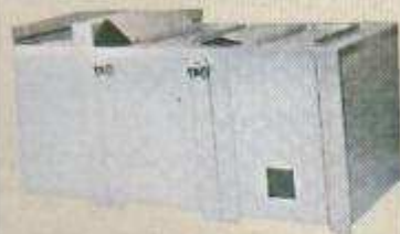
Impianto di lavaggio e manutenzione stampi modello 3 VS 70 l.

trasuoni I.E. in collaborazione con il committente. Per gli stampi dei settori fonderia alluminio e leghe, stampaggio plastica e iniezione gomma, il ciclo standard è composto da tre - cinque sezioni, dove vengono effettuate rapidamente tutte le fasi dell'intera manutenzione dello stampo: lavaggio caldo con ultrasuoni e detergente biodegradabile; risciacquo caldo con ultrasuoni e acqua; risciacquo idrocinetico con acqua e aria; passivazione/brillantatura neutra; protezione senza residuo e asciugatura a freddo o a caldo finale.