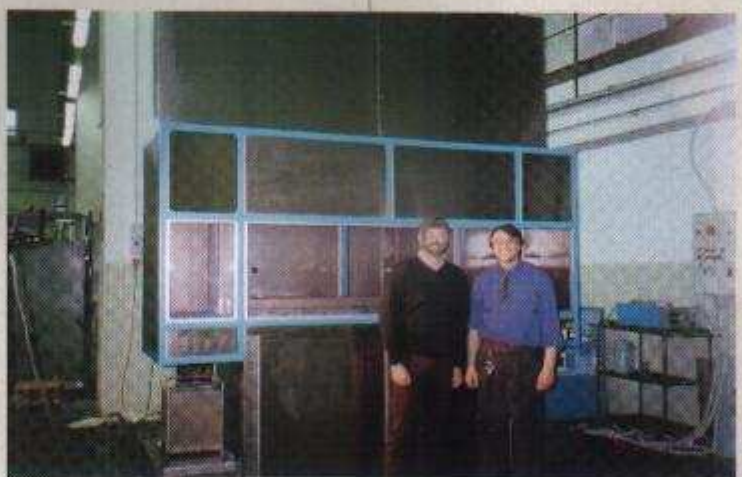
Impianto di lavaggio a ultrasuoni.