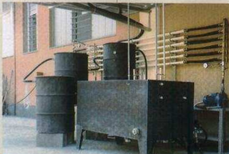
Impianto di ultrafiltrazione e trattamento acque.

una segnalazione: ripresa rapida del costo di investimento dell'impianto (normalmente dodici mesi); diminuzione dei costi di produzione del 5%, dei costi di manutenzione dal 10% al 25% e degli scarti dal 40% al 98%; aumento della durata di vita dello stampo, con diminuzione degli aggiustaggi periodici; possibilità di pulire filtri olio delle presse e parti di macchine che prima venivano pulite a mano e riduzione globale dell'impatto ambientale e del ri-