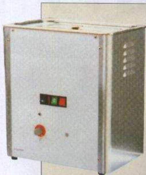
Macchina compatta a ultrasuoni serie Usa, per il lavaggio di piccole matrici, parti di stampi e altro ancora.

kHz, Piezo 25 kHz, Piezo 40 kHz, Piezo 70 kHz, UltraMagneto 20 kHz High Power con tecnologia avanzata, UltraPiezo 25 kHz High Power con tecnologia avanzata e UltraPiezo 40 kHz High Power con tecnologia avanzata).