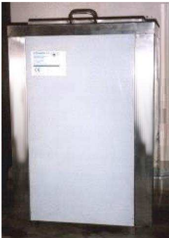
Macchina polifunzionale a detergente acquoso e ecosolvente, risciacquo e soffiatura asciugante ad aria, modello AC 250.

Si tratta di pulitrici sonore e lavatrici industriali ad ultrasuoni concepite per il lavaggio e la sgrassatura di particolari e pezzi di meccanica di alta precisione, di matrici e stampi, con un rapporto prezzo - prestazioni a portata della piccola e media azienda per ottenere un alto livello di qualità anche nelle piccole produzioni di manufatti in alluminio e leghe.